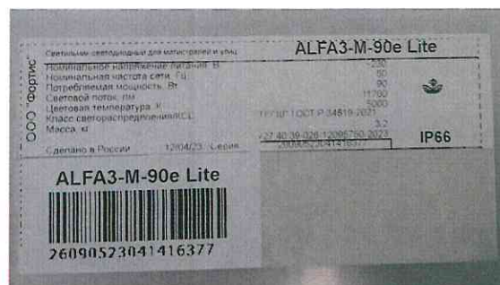
Рис.1. Фотография образца